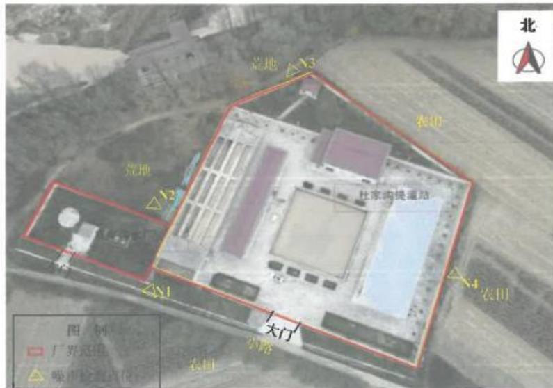
图 1 检测点位示意图