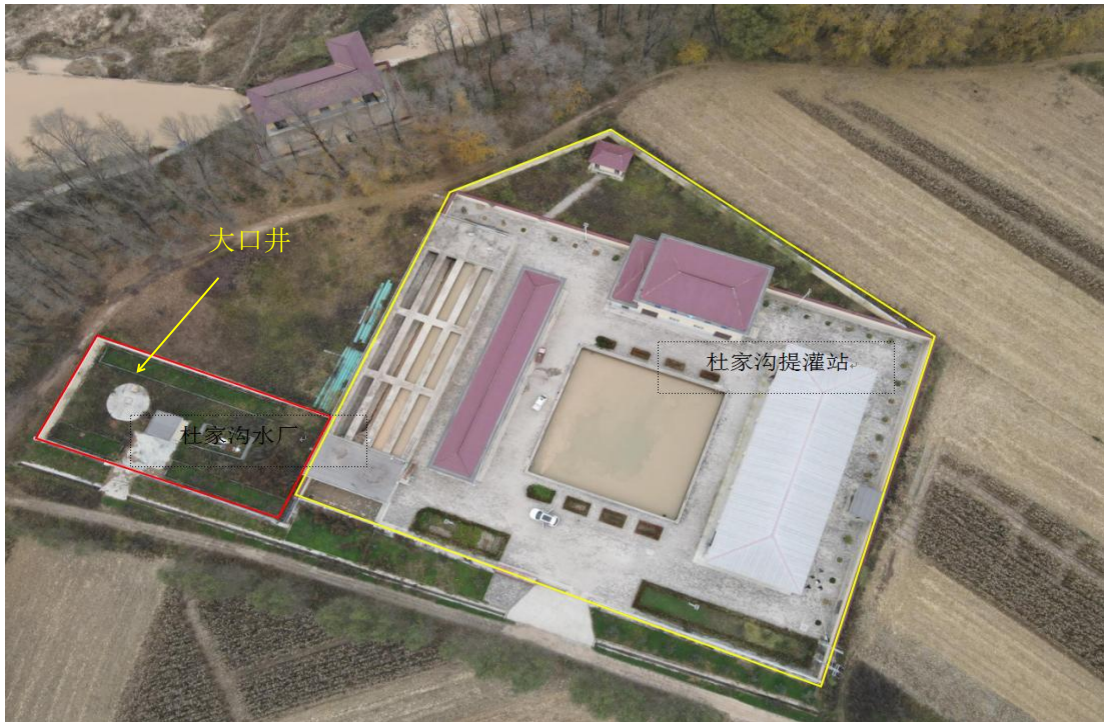
杜家沟水厂与杜家沟提灌站（航拍图）